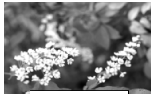
エゾノウミズザクラの花

キキンニ(アイヌ語)は文献・聞き取り情報ではエゾノウミズザクラだと考えられますが、ナナカマドだとする証言もあり調査室では特定されていません。エゾノウミズザクラは、初夏に房状に白い花が咲き暗赤色の実を付ける木です。主な利用法は流行病の神(パコロカムイ)の魔よけに玄関へ挿したり、水桶に浸けておき、その水を飲むと風邪の予防や、流行病に効くとされています。食用には枝や内皮を煎じて飲み、お粥に入れて食べられていました。(キキンニ自体は食べず、だし取りのみに使っていたようです。)